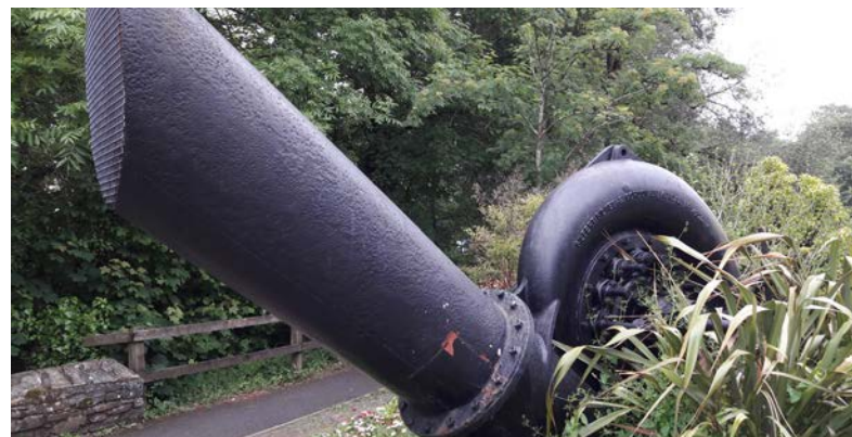
Eine Spiralturbine, Gilbert Gilkes & Gordon LTD Kandal No 4270 1937 in Ivybridge (Devon).