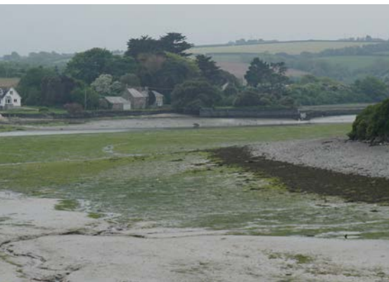
Blick über den Little Petherick Creek auf den Damm der St. Issey Seemill mit der Öffnung für das Flutschütz. Foto: Dr. Ralf Kreiner 2018.

Bei Wailes nicht erwähnt. Minchington/Perkins 1971 p. 12: „According to the Rev. Clark, vicar of Padstow, this mill was working until the railway came to Padstow in 1899. Grain was imported inwards and flour was exported direct from the quays alongside the mills. When the railway came to Padstow the company had to purchase and close the mills to enable the railway, which followed the line of the mill dam, to reach the town. Parts of the walls and parts of the wheel and wheel pit can still be seen.“ https://millsarchive.org/explore/mills/entry/6993/sea-mill-padstow#.W4_j07hCSM8