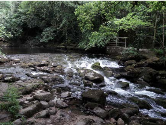
Das Wehr im River Erme der Stowford Paper Mill bei Ivybridge (Devon). Foto: Dr. Ralf Kreiner 2018.