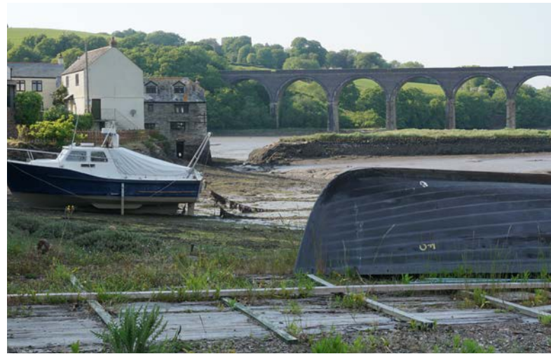
Antony Passage Mill am River Lynher bei Ebbe. Foto: Dr. Ralf Kreiner 2018.

außer Betrieb gegangen. Die letzten Überreste wurden durch die Deutsche Luftwaffe im Zweiten Weltkrieg ausgeradiert, schließlich war Plymouth wegen des Kriegshafens der Royal Navy die meistbombardierte Stadt Englands.