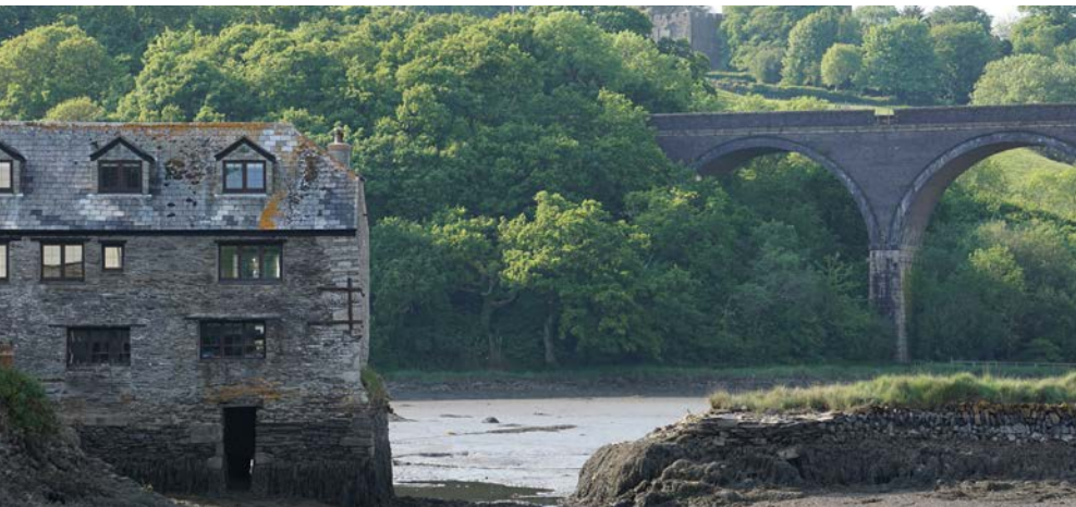
Antony Passage Mill mit der Öffnung für das Tidenschütz. Im Hintergrund ist Trematon Castle zu sehen.

R. Wailes II p. 30/31: „The Manor Mill of Trematon Castle. The grand old keep of Tremarton Castle stands on a strip knoll overlooking the river Lynhow, and below it a creek runs up into the country on which the Manor mill is situated. It is an ancient mill and a tidal one. A part of the creek has been enclosed and furnished with sluice gates; the tide flows into it and fills the mill pool at high water, driving the machinery on the fall and rise. I have known this mill working since 1860, but on visiting it during the summer of 1916, I found it had ceased working. The first notice I have of it is an account of repairs done to it in 1462-3, a copy of which is annexed. [Here follow various items of expenditure for repairs to the mill. Exchequer K.R. Bundle 461. No. 21 (1462-3)]. From „Devon & Cornwall Notes and Queries“, April, 1924, Vol. XIII, Part II, p. 94, H. Michell Whitley.“