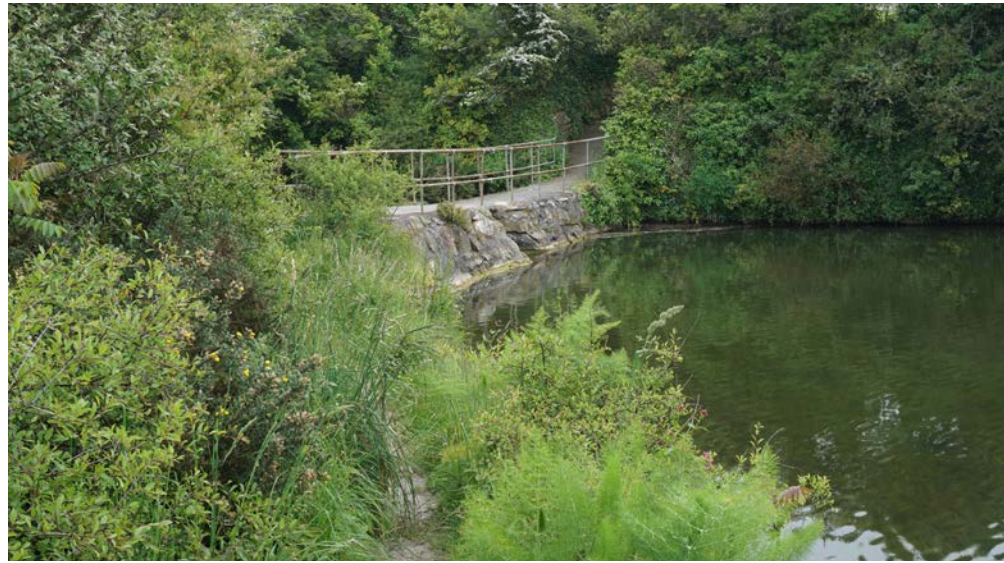
Absperrdamm des Teiches, der zur Padstow Seemill gehörte.

liegt. Wenn man dem Trail flussaufwärts folgt kommt man unmittelbar nach Ende der Bebauung von Padstow zum Standort der alten Padstow Seemill, der rechterhand vom ehemaligen Bahndamm liegt. Das alte Gezeitenbecken (Dennis Cove) mit Absperrdamm ist noch mit Wasser gefüllt. Von Mühlengebäuden oder -installationen ist nichts mehr zu sehen. | Padstow Seemill, River Camel (50.5323 N, 4.9349 W)