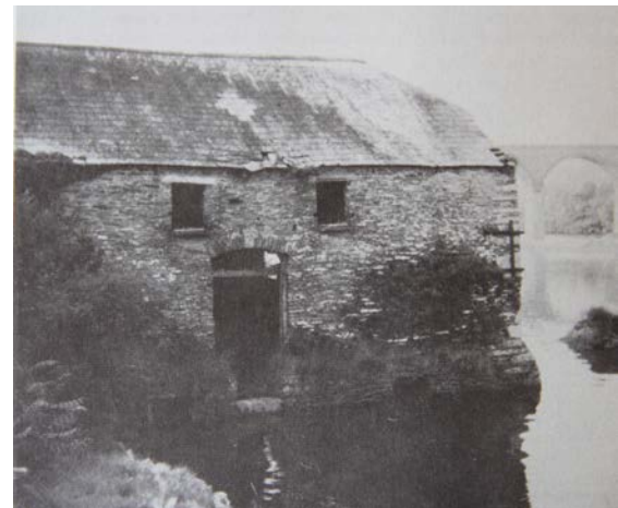
Antony Passage Mill im Zustand von 1971. Antony Passage Mill 1971, 20.