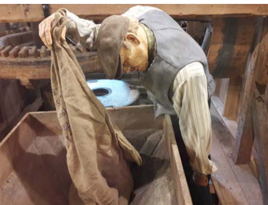
Der Müller als lebensgroße Puppe in der Bickleigh Mill. Im Hintergrund der zweite Mahlgang mit Kunststeinen.

at the mills'. Applications had to be made to Richard Borrow at the mills. In 1816 they were to be sold again and described as containing three mills with french stones, a bolting mill and a dwelling house. An advertisement in the West Briton for 24 April 1846 described the pond as being 4 1/2 acres; the whell and going gear were said to be nearly all new and there were three pairs of 4 ft 4 in french stones, the wheel, 30 ft in diameter by 4 ft wide, being capable of driving another pair. Application was to be made to the proprietor, Thomas Tregaskis.