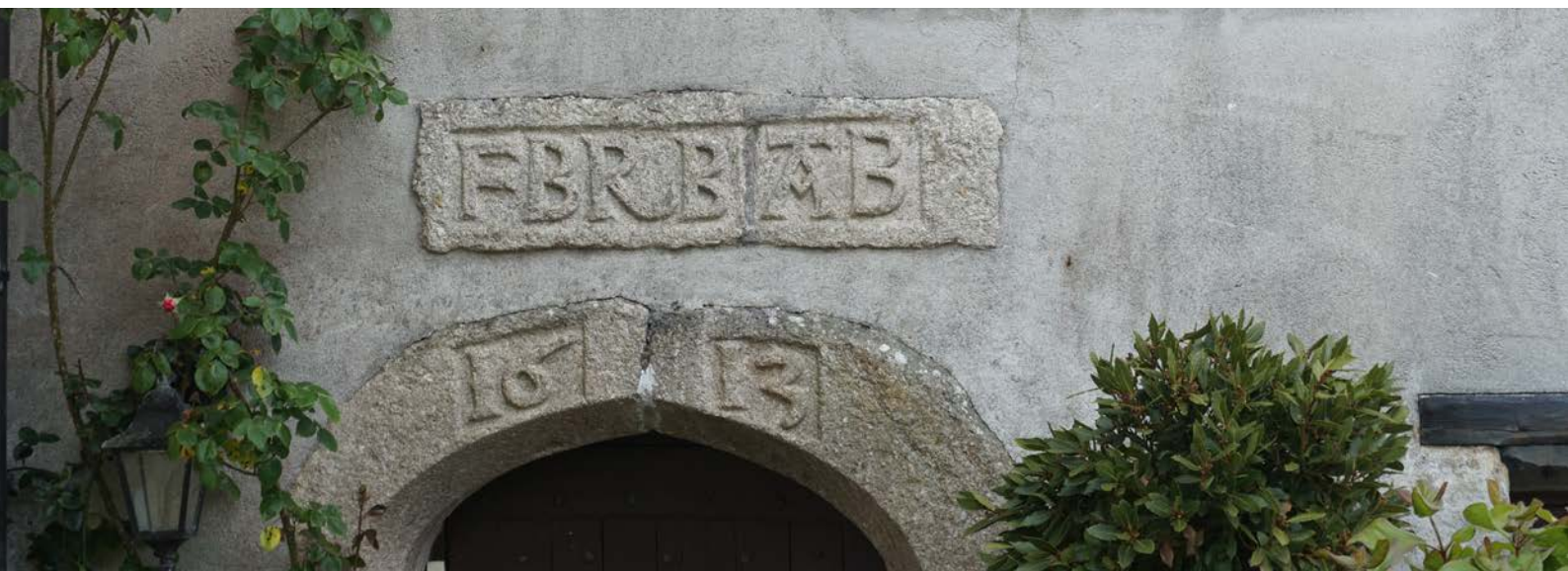
Inschrift mit Datum ,1613' an der Antony Passage Mill.

Nach dem Foto bei Minchington/Perkins 1971 p 14 schienen mir noch die Überreste der Gezeitenmühle in Hayle mit einem ausgedehnten Gezeitenbecken besichtigungswert. Durch ihre Lage im äußersten Nordwesten Cornwalls passte sie aber nicht mehr in unseren Zeitplan. Stattdessen konnten wir aber noch einen Ausflug nach Padstow an der Nordküste Cornwalls machen. Nachdem wir uns hier in einem Café gestärkt hatten, konnte ich mit Andrew in Sachen Gezeitenmühlen noch einen Fußmarsch über den Camel Trail, einen Wander- und Radweg auf einer alten Bahntrasse unternehmen. Er leitet seinen Namen nicht von Kamelen oder einer bekannten Zigarettenmarke her, sondern vom River Camel in dessen Mündungstrichter Padstow