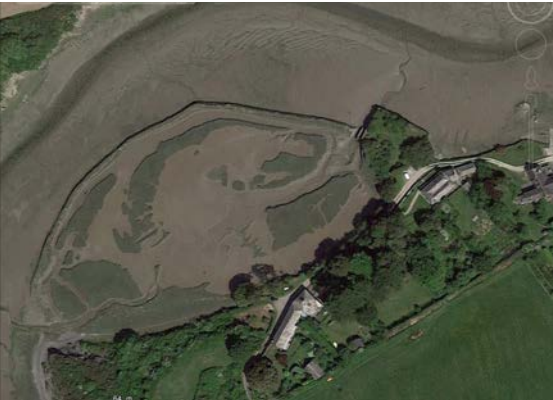
Der Damm des Tidebeckens, der zur St. Issey Seemill gehörte.

liegt. Wenn man dem Trail flussaufwärts folgt kommt man unmittelbar nach Ende der Bebauung von Padstow zum Standort der alten Padstow Seemill, der rechterhand vom ehemaligen Bahndamm liegt. Das alte Gezeitenbecken (Dennis Cove) mit Absperrdamm ist noch mit Wasser gefüllt. Von Mühlengebäuden oder -installationen ist nichts mehr zu sehen. | Padstow Seemill, River Camel (50.5323 N, 4.9349 W)