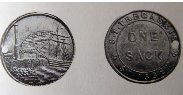
„One Sack“-Marke, die einen Zweimastsegler am Pier vor der St. Issey Seemill zeigt. Aus: Minchington/Perkins 1971, 13.

Die Koordinaten, die in millsarchive.org für diese Mühle angegeben werden sind unbrauchbar, da sie auf der Karte zu einem völlig falschen Ort führen. ( https://millsarchive.org/explore/mills/entry/6946/tide-mill-trevorrick#.W4_kxbhCSM8 ). Ich habe sie mittels Google Earth neu ermittelt.