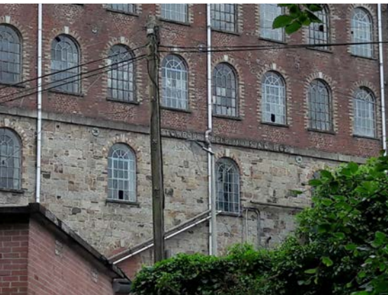
Das Hauptgebäude der Stowford Paper Mill in Ivybridge vor dem Beginn der Umbaumaßnahmen. Foto: Dr. Ralf Kreiner 2018.