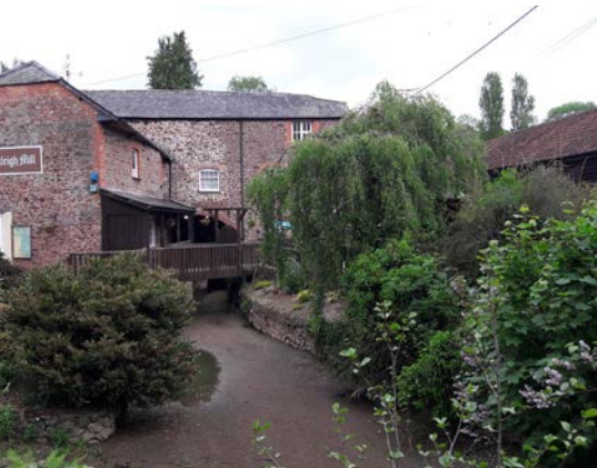
Die Bickleigh Mill bei Tiverton mit ihrem trockenengefallenen Unterwasser. Foto: Dr. Ralf Kreiner 2018.