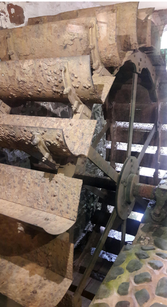
Das unterschlächtige Wasserrad in der Bickleigh Mill bei Tiverton.

Soweit zu den Gezeitenmühlen von Devon und Cornwall. In Ivybridge unternahmen wir noch einen Spaziergang am gefällereichen River Erme, der im Dartmoor entspringt und in Ivybridge einst drei Mühlen antrieb, eine Getreidemühle, eine Papiermühle und eine Walkmühle. ( http://www.southdevonaonb.org.uk/text.asp?PagelD=236 ). Stowford Mill, Ivybridge, Devon (50.394 N, 3.920 W)